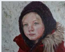
Exposition de peinture