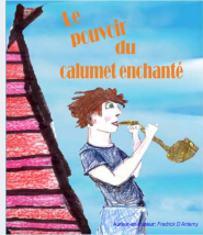
Le pouvoir du calumet enchanté